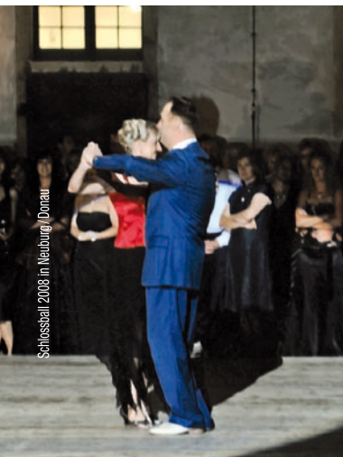
Schlossball 2008 in Neiburg/Donaue

Alle Infos immer unter: www.schlossball.de