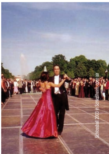
Schlossball 2003 in Schleifheim, oben air